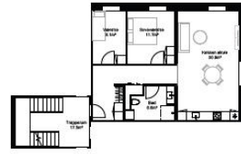
3 rum (type 1)