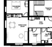
3 rum (type 2)