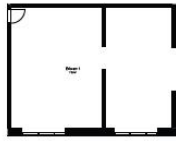
Erhverv (type 1)